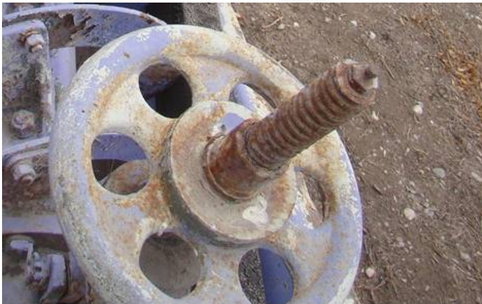
Figura 1. Formación de óxidos de hierro en una estructura formada por una aleación de hierro expuesta a la atmósfera abierta, causando un deterioro irreversible.

U. Schwertmann, R.M. Cornell. Iron oxides in the laboratory: Preparation and characterization, 2ª ed. Wiley-VCH, 2000 Weinheim Alemania.